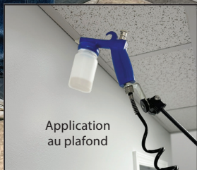
Application au plafond

Les anciens pistolets sans bouton poussoir verrouillable peuvent être modifiés avec le kit portant la référence 30275.